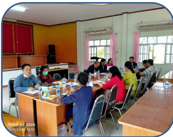
ประชุมคณะกรรมการติดตามและประเมินผลแผนพัฒนาท้องถิ่น ประจำปีงบประมาณ 2563 วันที่ 11 พฤศจิกายน 2563 ณ ห้องประชุมองค์การบริหารส่วนตำบลกุดชุมแสง

3) ในการจัดทำแผนพัฒนาท้องถิ่นครั้งต่อไป ให้พิจารณาบรรจุเฉพาะโครงการที่สามารถจะดำเนินการได้หรือมีงบประมาณเพียงพอ หากมีการเปลี่ยนแปลงแก้ไขเพิ่มเติมโครงการหรือมีงบประมาณสามารถดำเนินการขอแก้ไขเพิ่มเติมแผนพัฒนาในภายหลังได้